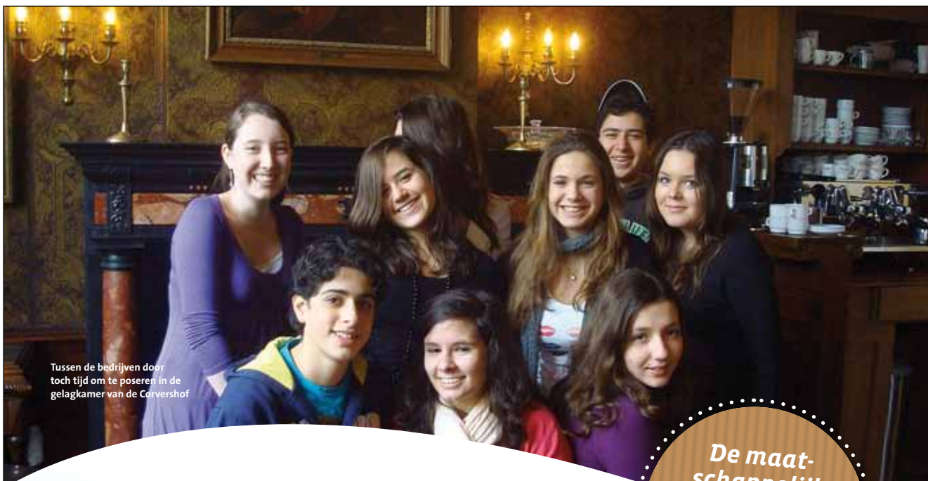
Tussen de bedrijven door toch tijd om te poseren in de gelagkamer van de Corvershof

De maatschappelijk stagiair is nu onze jongste vrijwilligster